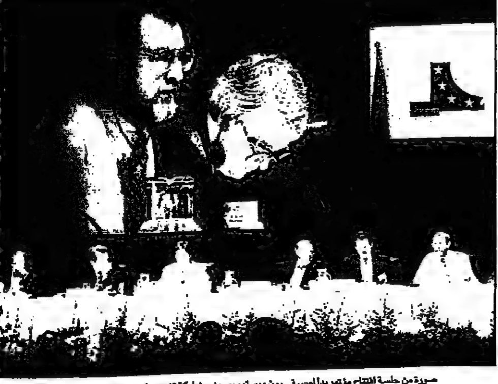
مجموعة من جلسة افتتاح مؤتمر بدأ امس في بون ويستمرون بمشاركة 40 زعيما من دول الاتحاد الاوروبي وأمريكا وكندا حول سبل تنظيم التجارة عبر شبكة الانترنت

الكويت - يو بي سي: قال مسؤولون بارزون في بيت التمويل الكويتي امس الاثنين ان الاساليب المصرفية الاسلامية عموما ونظام المراجعة خصوصا شهدت ازديادا ملحوظا في سوق لال الكويتية نتيجة لثبات كبير عليها من جانب الزبائن والمصارف. وقال مسؤول في وزارة الاقتصاد الكويتية ان تطوير مصافيها الرئيسية لتكفي الطلب المتزايد على النفط في المنطقة العربية.